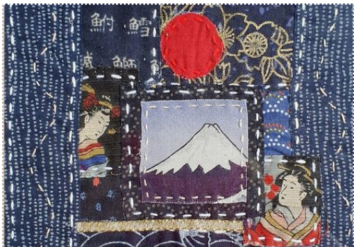
Tableau en patchwork japonais

Maryse Druez vous propose un atelier créatif avec de beaux tissus japonais traditionnels que vous assemblerez librement en les cousant, à la main, au point avant (sashiko). Un moment de concentration et d'évasion pendant lequel vous serez initié à cette technique ancestrale, le « boro ». Chaque participant repartira avec son tableau prêt à encadrer.